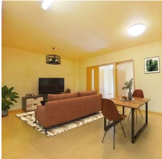
LDKヴァーチャルステージング