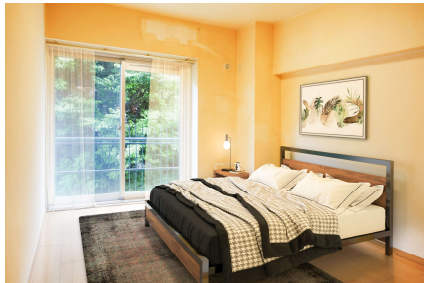
寝室ヴァーチャルステージング