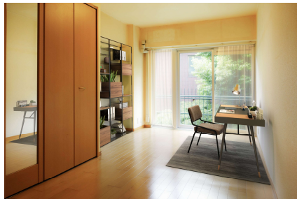
書斎ヴァーチャルステージング